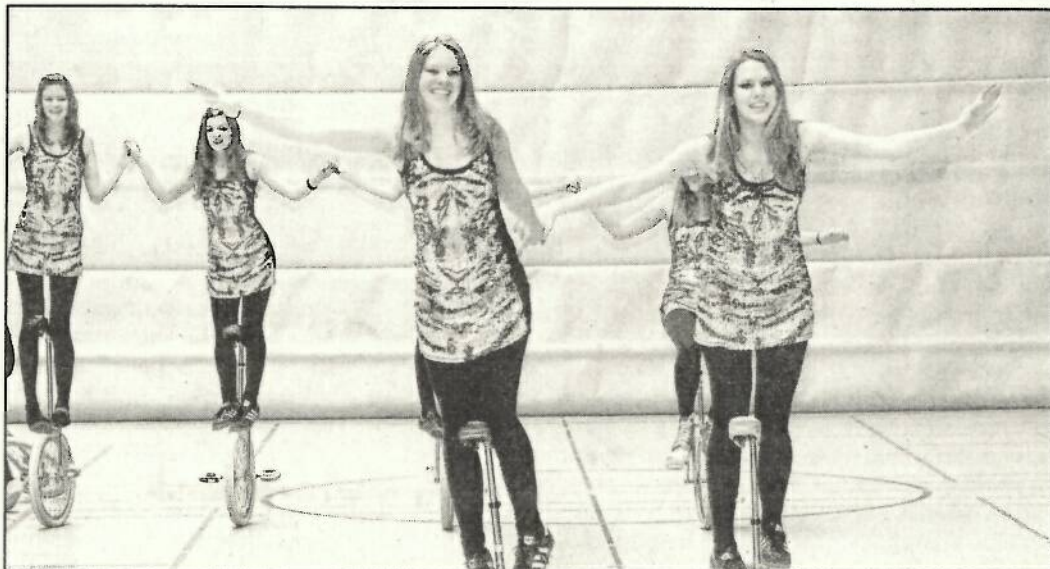
Die Mädchen aus der 10. Klasse Sportprofil fahren im Musical „Dschungelbuch“ eine katzenhafte Kür zum Tigerlied „Sei mal richtig böse“.

LANGENHORN (sno). „Im Dschu, Dschu, Dschu im Dschungel“ radeln am 14. und 15. Dezember über 100 Einräder zur Musik von Konstantin Wecker.